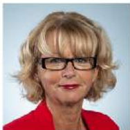
PATRICIA LEMOINE députée REN de la 5ème circonscription de Seine-et-Marne

Ce plan commence désormais à être déployé et il convient, dans un premier temps, d'attendre pour qu'il porte ses fruits et améliore la situation. Néanmoins, il conviendra de rester vigilant sur sa bonne application : je n'hésiterai pas à défendre des mesures plus coercitives, par la loi, si rien ne change (...)