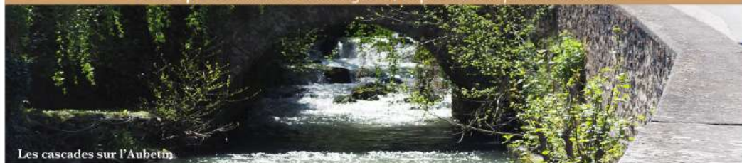
Les cascades sur l'Aubethy

Directeur de la publication : Sébastien HOUDAYER / Rédaction : Po&Dito / Mise en page : Prophetie Graphique Crédits photos : Mairie de Saint Augustin / Impression : Imprimerie Beaudoin